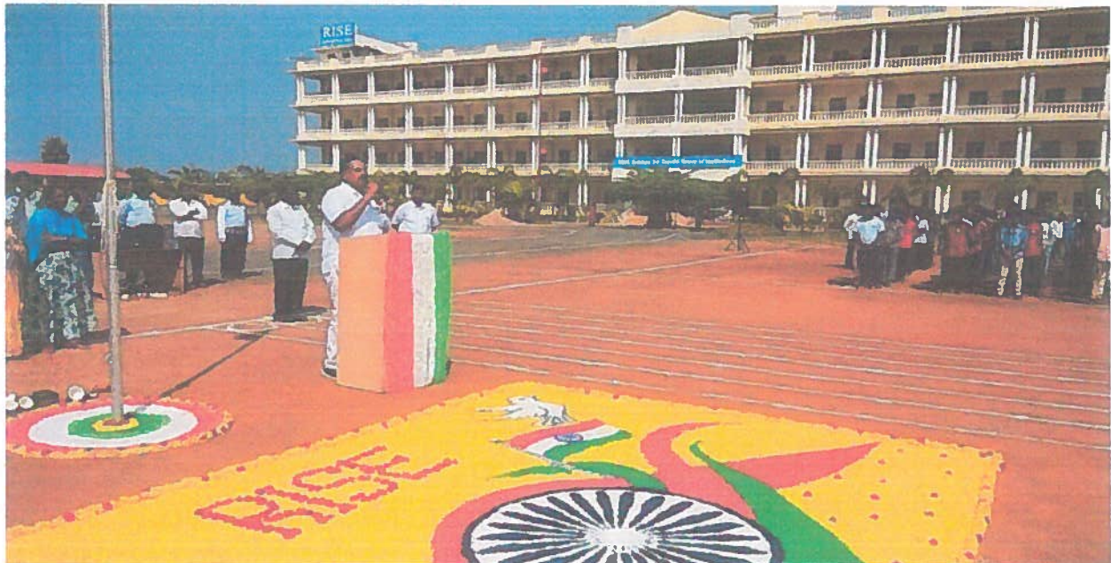
SPEECH BY OUR HONOURABLE CHAIRMAN

PRINCIPAL RISE KRISHNA SAI GANDHI GROUP OF INSTITUTIONS VALLURU: ONGOLE.