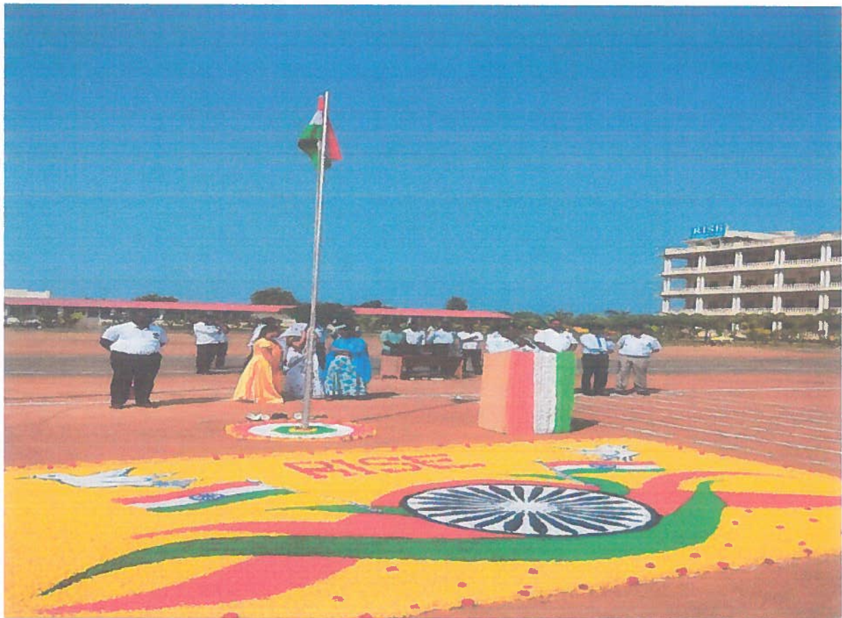
REPUBLIC DAY CELEBRATIONS IN RISE GANDHI

PRINCIPAL RISE KRISHNA SAI GANDHI GROUP OF INSTITUTIONS VALLURU:: ONGOLE.