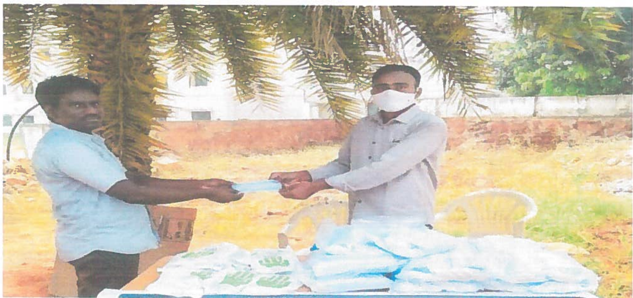
DISTRIBUTION OF MASKS & SANITIZERS TO PEOPLE'S

PRINCIPAL RISE KRISHNA SAI GANDHI GROUP OF INSTITUTIONS VALLURU: ONGOLE, A.P.