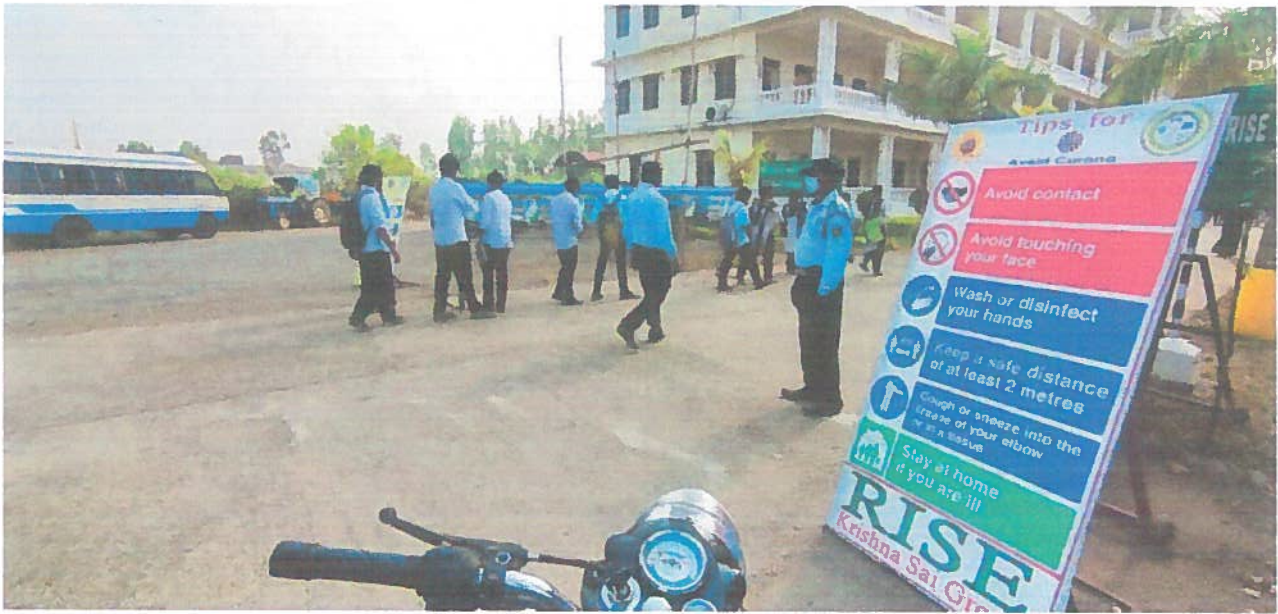
MONITARINS OF COVID RESTRICTIONS