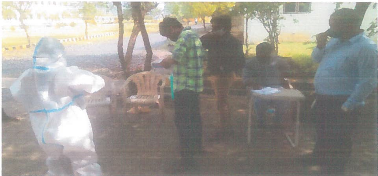
COVID TEST REGISTRATION

PRINCIPAL RISE KRISHNA SAI GANDHI GROUP OF INSTITUTIONS LURU: ONGOLE