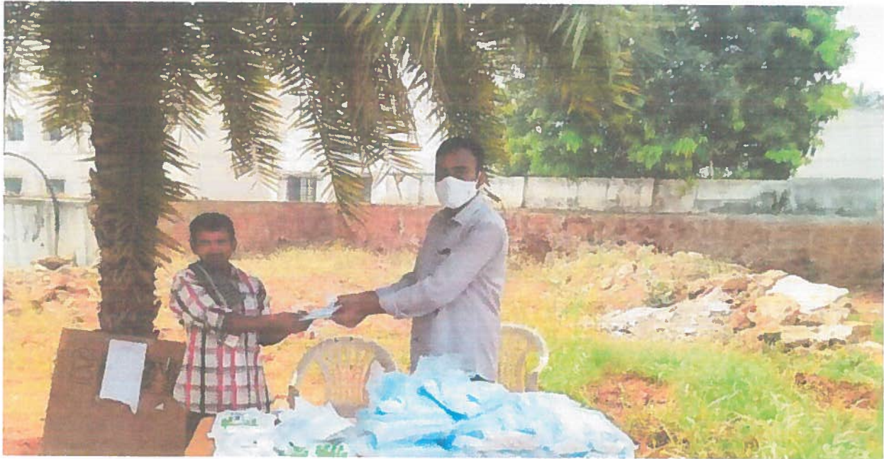
DISTRIBUTION OF MASKS TO VALLUR VILLAGE PEOPLE'S