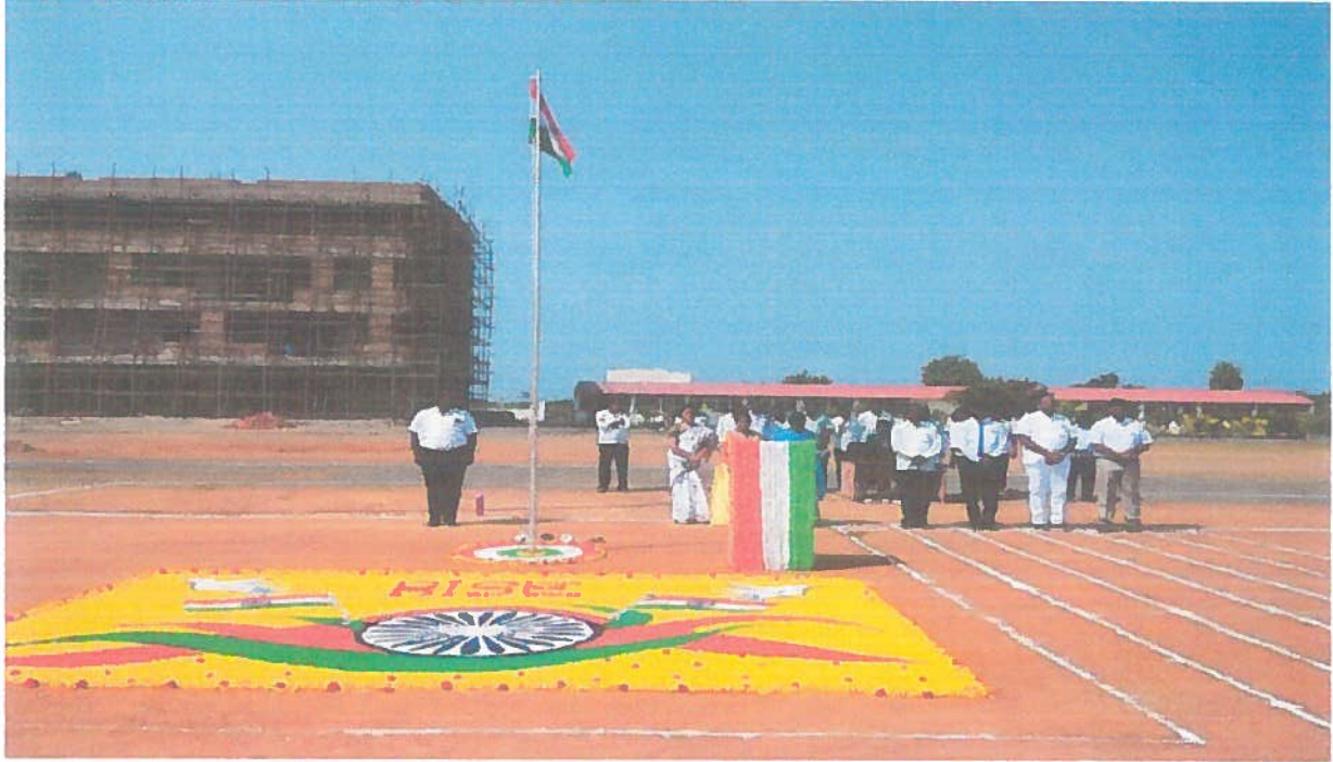
REPUBLIC DAY CELEBRATIONS IN RISE GANDHI