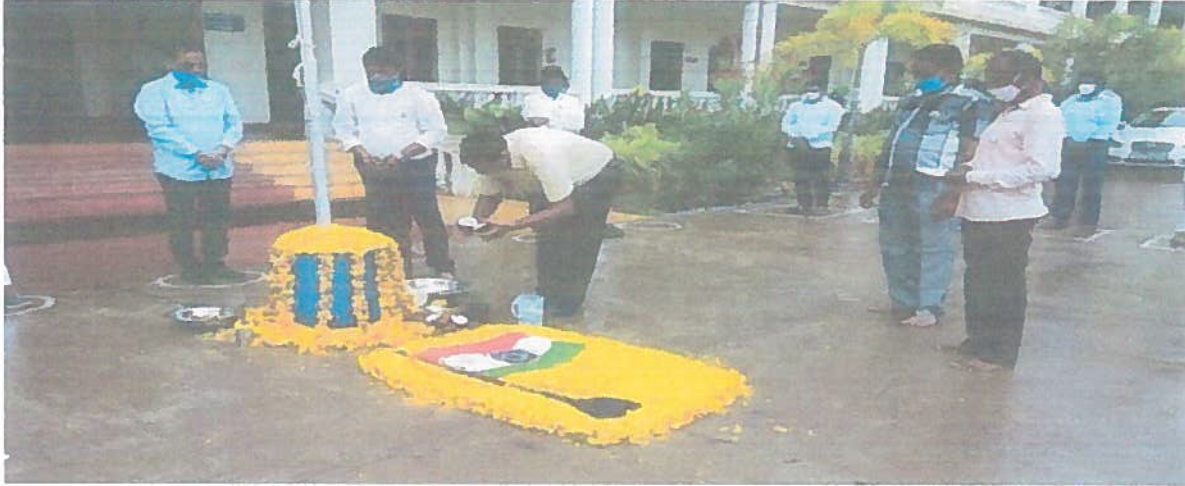
DOING POOJA TO THE NATIONAL LEDERS